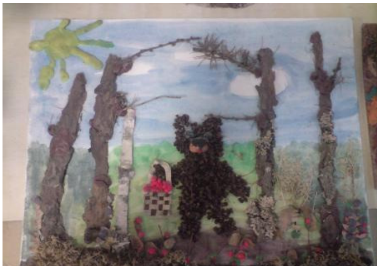
Корзинка с грибами