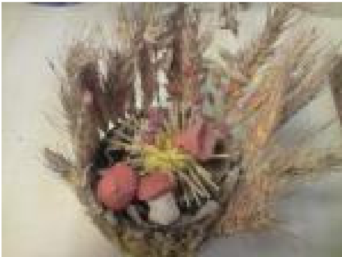
Корзинка с грибами